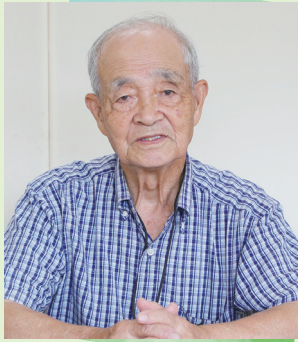
出牛谷津長生クラブ